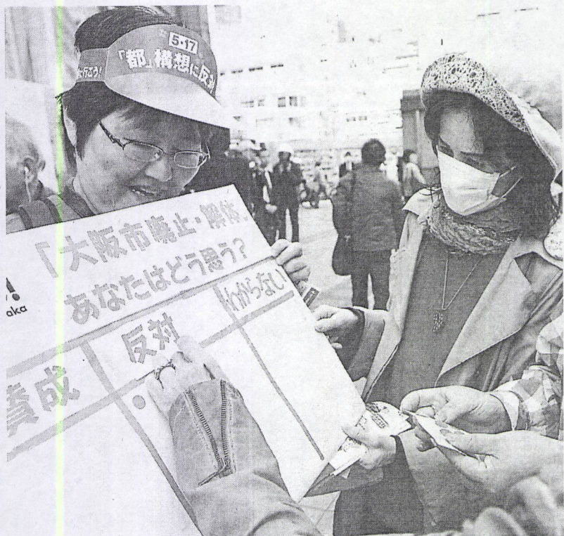
①橋下市長も参加した市主催の住民投票説明会。14日、大阪市平野区。大阪都構想についてシール投票を呼びかけて対話する人たち。18日、大阪府北区。